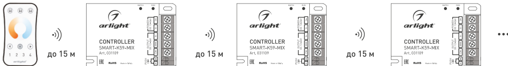
Рисунок 2. Ретрансляция сигнала от пульта ДУ (до 15 м на открытом пространстве)