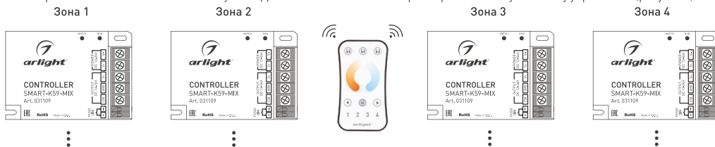
Рисунок 3. Вариант построения системы с 4-зонным пультом дистанционного управления

3.10. При использовании многозонных пультов ДУ или панелей можно построить разветвленную систему управления [рисунок 3].