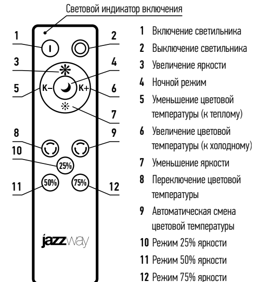
Пульт дистанционного управления (ДУ)